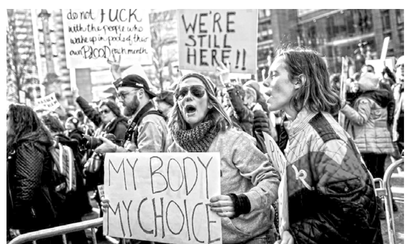
El 8 de marzo las mujeres del mundo volverán a movilizarse

Resulta muy elocuente la declaración realizada en los días posteriores a la movilización por reconocidas feministas como Linda Alcoff, Nancy Fraser y Ángela Davis, entre otras, y en la que se impulsa un llamado a continuar en las calles con un paro el próximo 8 de marzo. Allí se señala que “el imperialismo estadounidense, el militarismo y el colonialismo de los colonos fomentan la misoginia en todo el mundo. No es coincidencia que Harvey Weinstein, en sus largos años tratando de silenciar y aterrorizar a las mujeres, usó la empresa de seguridad Black Cube, que está formada por ex agentes del Mossad y otras agencias de inteligencia israelíes. Sabemos que el mismo Estado que envía dinero a Israel contra los palestinos, como es el caso de Ahd Tamimi y su familia, también financia las cárceles en las que mujeres afroamericanas como Sandra Bland y otras han muerto”.