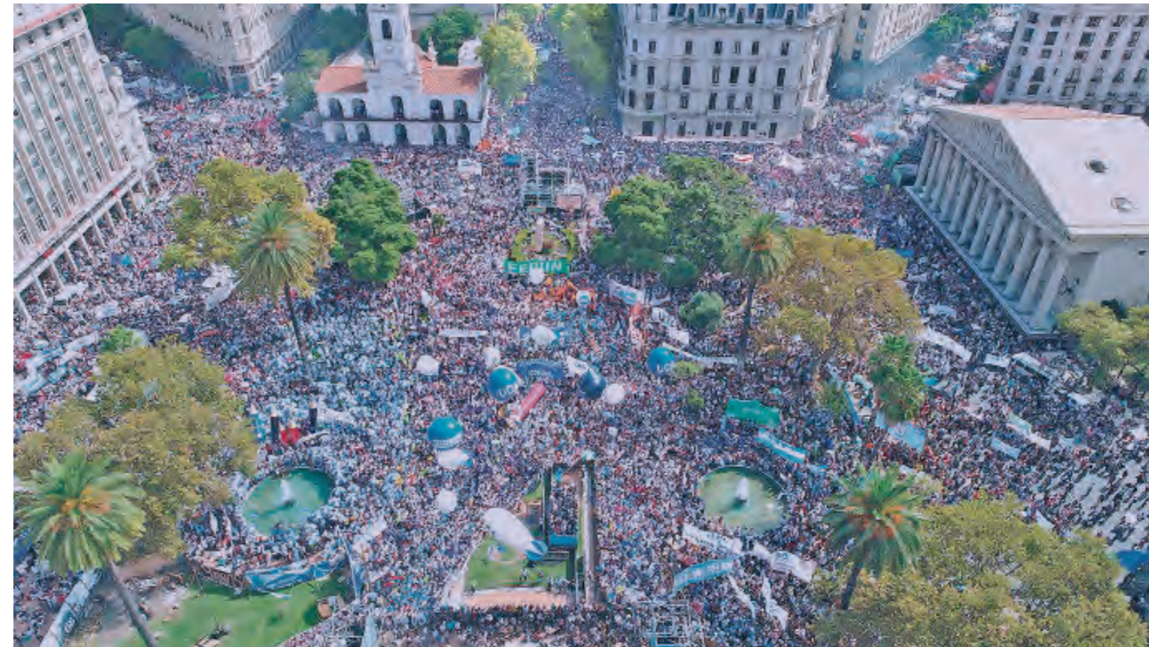
Retomemos las movilizaciones masivas contra el ajuste como las de 2017

Para imponer el techo salarial, el gobierno ya eliminó la paritaria nacional docente. A los bancarios,