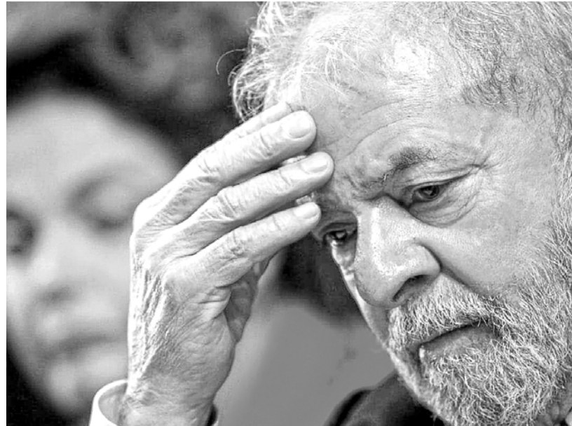
Lula gobernó para los patrones y las multinacionales

Odebrecht –durante el gobierno lulista– replicó ese “modelo” de sobornos en la Argentina (con Cristina Kirchner y ahora Macri) y la Venezuela de Chávez–Maduro. En Perú está preso el ex presidente Ollanta Humala y prófugo el otro ex, Alejandro Toledo, y Macri y el presidente Santos de Colombia reconocieron que Odebrecht financió sus campañas electorales. O sea, se digan “de derecha o de centroizquierda”, todos estos políticos están involucrados en este entramado capitalista corrupto, mientras pierde el pueblo trabajador.