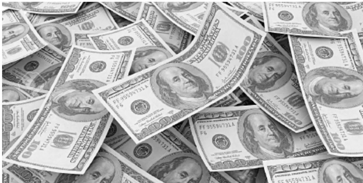
Crecen la deuda, la bicicleta financiera y la fuga de capitales

Macri quiere también ponerle un techo de 15% y sin “cláusula gatillo” a las negociaciones paritarias,