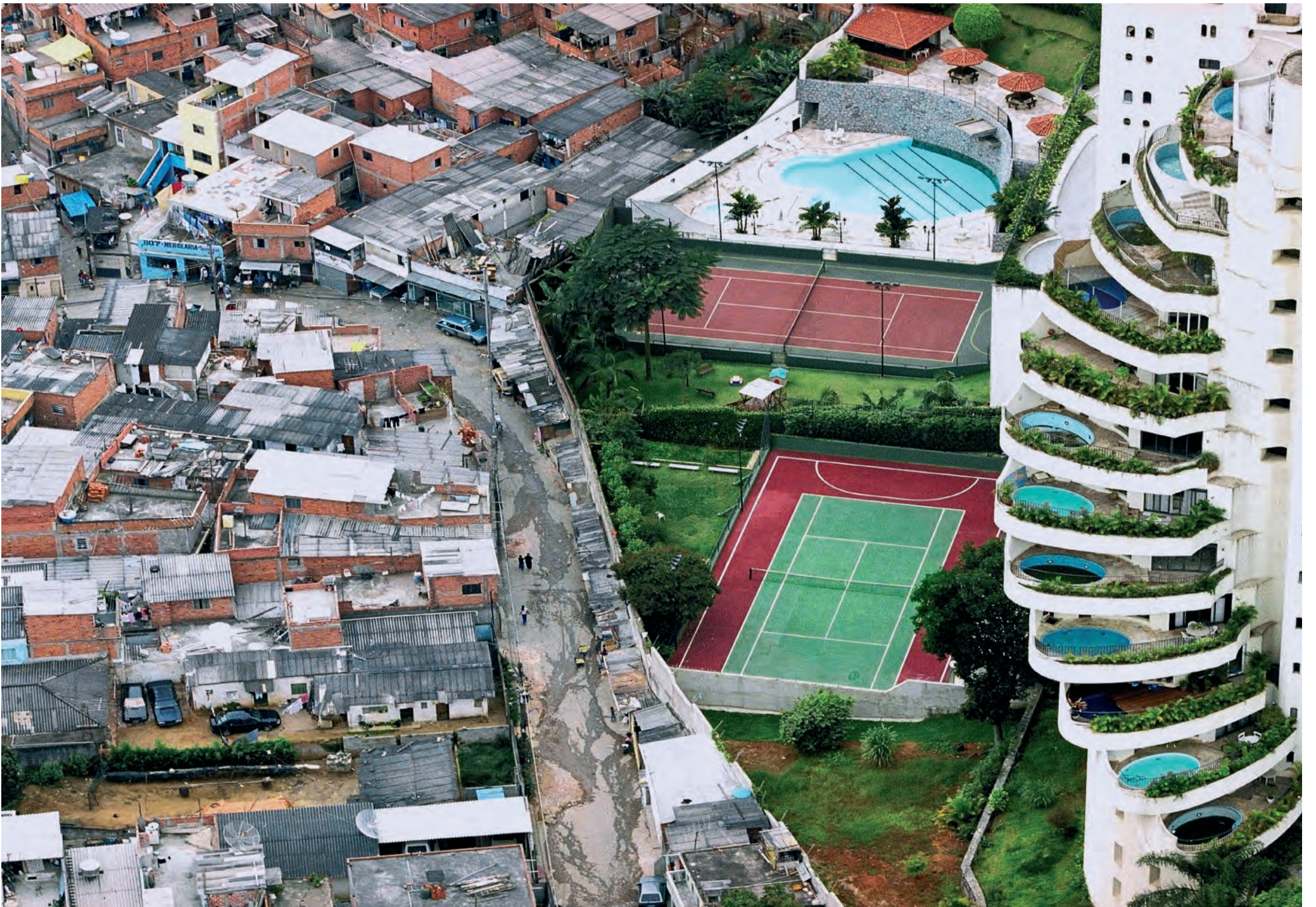
Contraste: de un lado del muro los pobres de la favela de Paraisópolis. Del otro, los ricos del Morumbi en San Pablo, Brasil

Un reciente informe de la ONG Oxfam muestra que los grandes capitalistas se quedan con más del 80% de la nueva riqueza creada cada año por el trabajo de toda la humanidad.