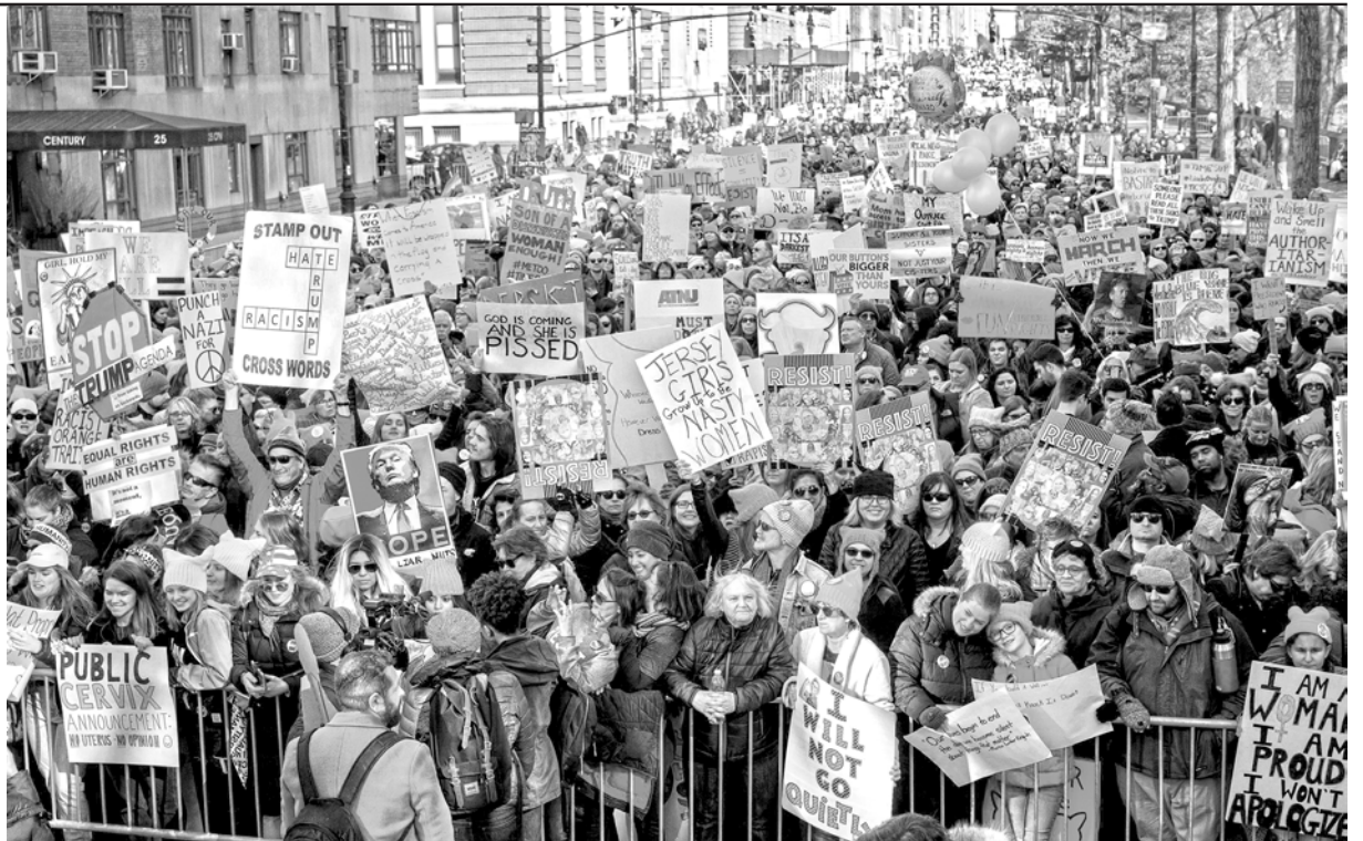
Masivas movilizaciones en los Estados Unidos por los derechos de las mujeres y contra Trump

Aquellas no fueron las únicas reivindicaciones presentes en las calles. Al calor del movimiento que comenzó a gestarse a mediados de 2017 con las denuncias de abuso sexual por parte de un gran número de actrices de Hollywood, las movilizaciones también expresaron el repudio a la impunidad de violentos y abusadores que pululan en el mundo del espectáculo y en otros espacios donde los mayores niveles de opresión resultan escollos superiores al momento de las denuncias, como por ejemplo en el ámbito del trabajo y, sobre todo, en donde prima la informalidad