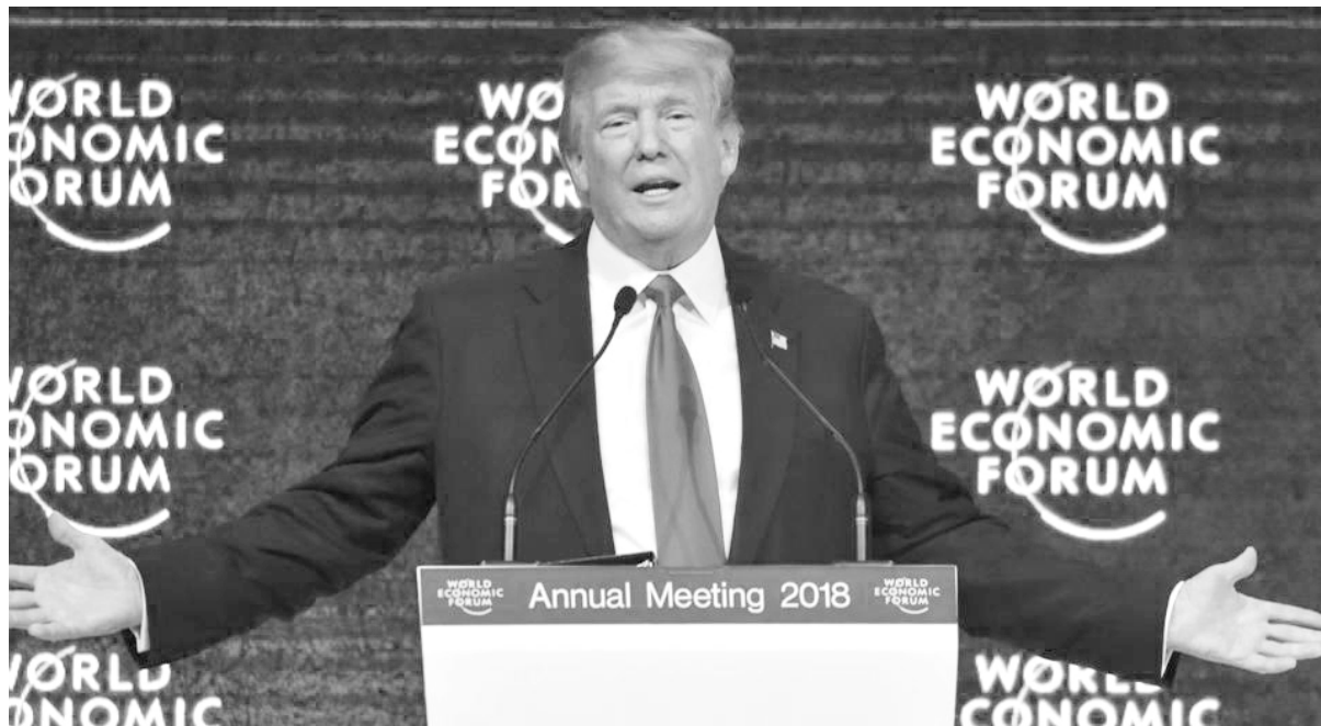
Trump fue felicitado en Davos por los líderes empresarios

Año tras año los hombres más ricos del mundo como Bill Gates, de Microsoft, los grandes banqueros, los CEOs de las más grandes multinacionales y los gobernantes de los principales países intercambian información de cómo marchan los planes de ajuste que se aplican en