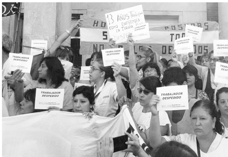
Macri ajusta la salud despidiendo trabajadores

Este ataque a los trabajadores del Posadas es un ataque a la salud del pueblo trabajador. Por ello se llevó adelante una jornada de lucha convocada por la Cicop el martes 23 de enero, por la reincorporación inmediata de los compañeros des-