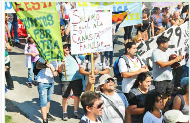
Movilización en defensa de la educación pública

A través de un decreto, el gobierno decidió cancelar la paritaria, que se establecía en el artículo 10 de la ley 26.075 (de financiamiento educativo), además de recortar la representación gremial de Ctera de cinco miembros a uno.